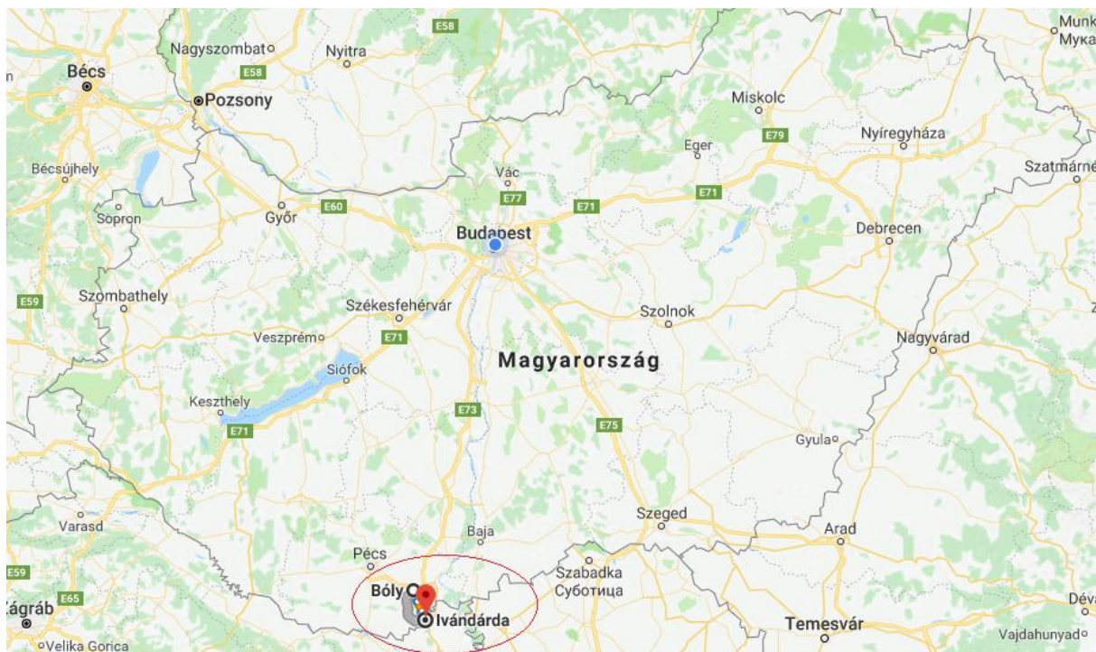
Boly és Ivándárda Magyarország térképén

A beruházás megvalósításának első szakasza az engedélyezési és kiviteli tervek elkészítésére, valamint a jogerős építési engedély megszerzésére kiírt közbeszerzési eljárás megindításával 2016. december 23-án kezdődött meg. A közbeszerzési eljárás során a TI az eljárás dokumentumait és az egyes eljárási cselekményeket az átláthatóság, jogszerűség és a tisztességes verseny biztosításának szempontjából vizsgálta.