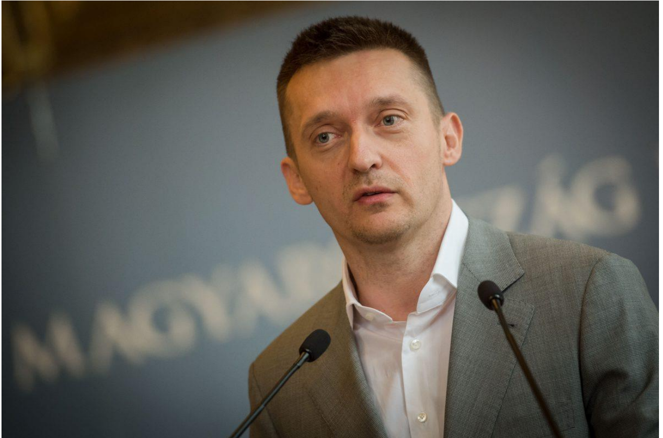
Rogán Antal

kommentálta, hogy „nem szoktam alaptalanul kérkedni, de vállalom a kapcsolataimat”.