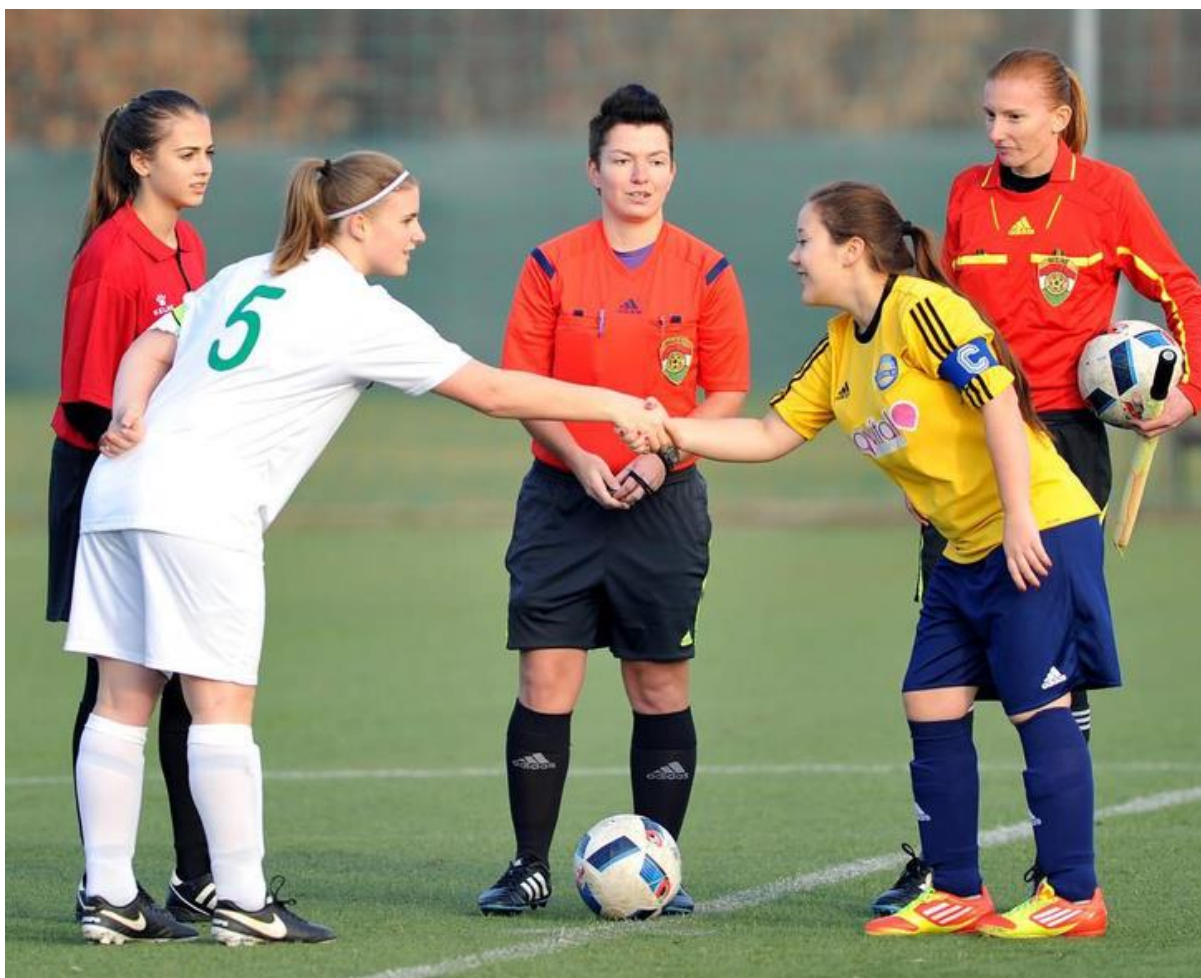
U18 női Bene Ferenc Labdarúgó Akadémia – Csákvár