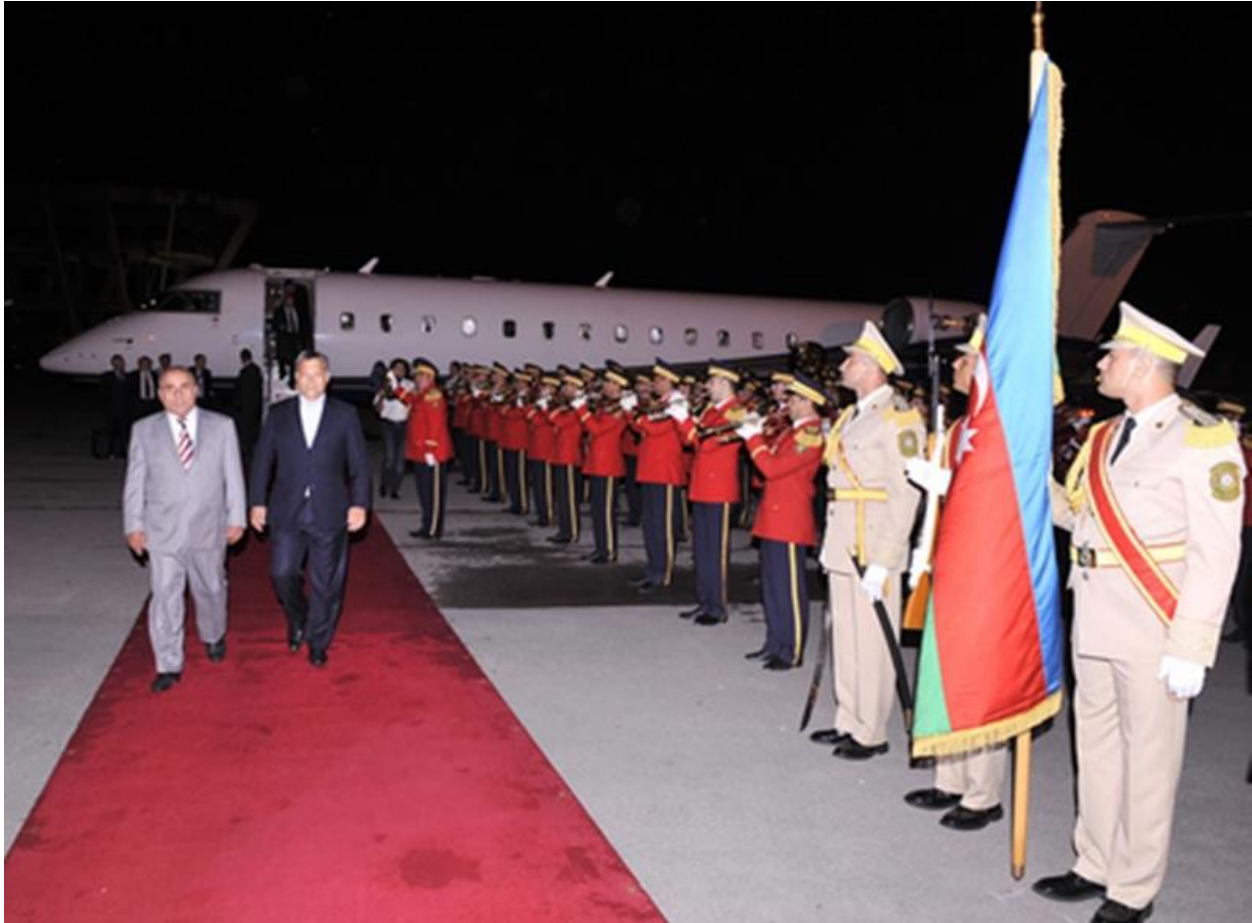
Jakub Ejubov és Orbán Viktor a bakui repülőtéren 2012-ben

Pontosan öt éve, hogy Magyarország nagy nemzetközi megrökönyödést keltve kiadta Azerbajdzsánnak Ramil Safarovot, a baltás gyilkost. A hála nem politikai kategória, nem is pörgött fel különösebben a két ország gazdasági kapcsolata a gesztus nyomán. Mégis mutatunk ezekből az időkől egy különös tranzakciót: egy szoros bakui kormánykapcsolatokkal rendelkező offshore cég dollármilliókat kapott a magyar MKB bankban vezetett bankszámlájára Safarov kiadása után.