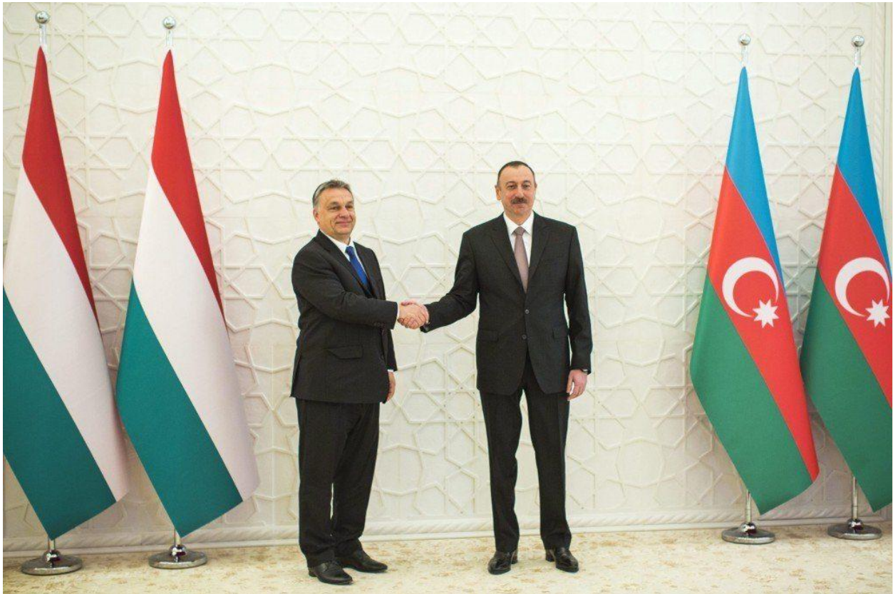
Orbán Viktor és Ilham Alijev

Miközben 2012 és 2014 között az azeri kormány tömegével tartóztatott le politikai aktivistákat és újságírókat, az ország kormányzati és üzleti elitje titkos bankszámlákat használt arra, hogy európai politikusokat fizessen le, luxuscikkeket vásároljon vagy egyéb tranzakciókat bonyolítson velük. A tisztázatlan eredetű pénzekből Magyarországra is jutott: egy befolyásos azeri politikus fiának Budapesten nyitott bankszámlájára több mint kilencmillió dollár érkezett 2012-ben, éppen akkor, amikor a